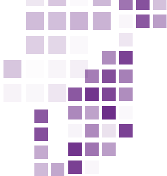
Figura 1 Índice de Fortaleza del Diseño Electoral de Género (IFDEG): dimensiones, indicadores y medición